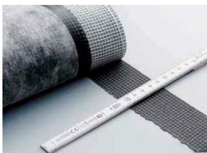
Základní tryska pro optimální šíři svaru