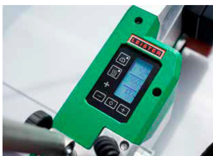
Regulovatelné svařovací parametry

Kompaktní svařovací automat UNIROOF 300 je vhodný pro svařování středně velkých až velkých plochých střech a je tak ideální jako základní přístroj.