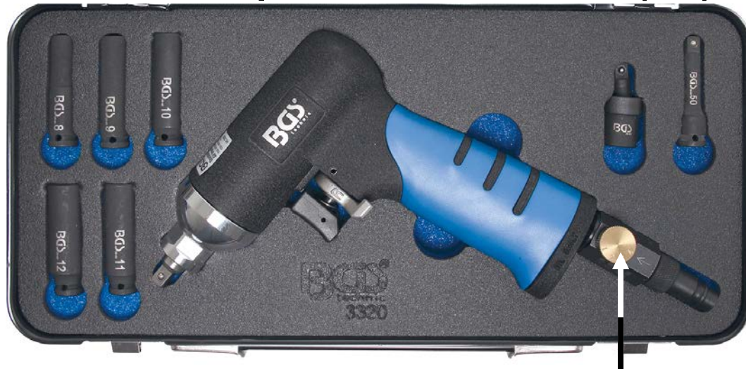
Regulador de par