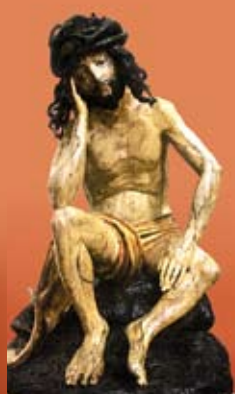
Bolestný Kristus z Prešova