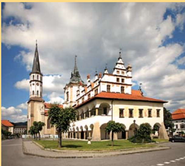
Kostol sv. Jakuba a renesančná radnica v Levoči

Dielo Majstra Pavla z Levoče vďaka vysokej formálnej kvalite dosahuje špičkovú úroveň svojich vtedajších vzorov. Oprávnené teda tvorí súčasť najcennejšieho kultúrneho dedičstva aj z dnešnej európskej perspektívy.