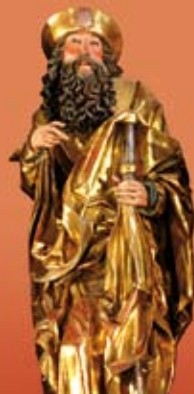
Socha sv. Jakuba z hlavného oltára v Levoči