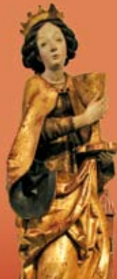
Socha sv. Barbory z oltára františkánskeho kostola v Okoličnom