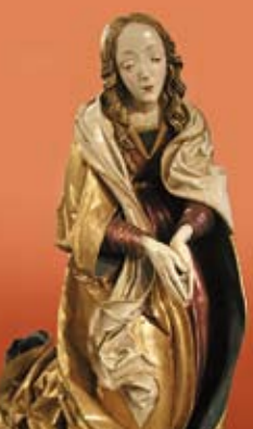
Panna Mária zo súsošia Narodenia v Levoči