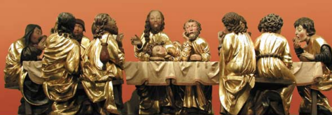
Súsošie Poslednej večere z predely hlavného oltára farského Kostola sv. Jakuba v Levoči